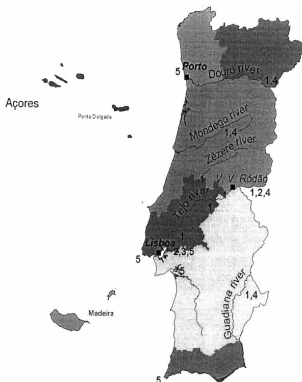
Mapa n.º 2