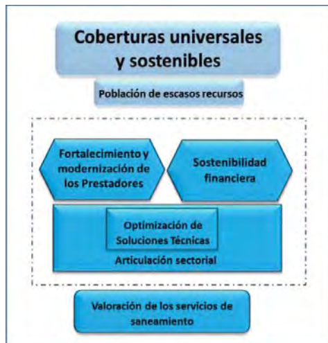
Gráfico N° 2 Esquema de la Política Nacional