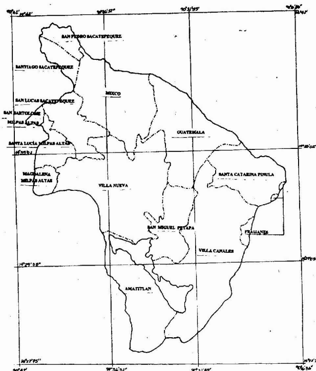
MAPA DEL AMBITO DE COMPETENCIA DE -AMSA- El área de la Cuenca del Lago de Amatitlán se encuentra ubicada en: 90° 42' a 90° 15' 86" Longitud 14° 42' a 14° 22' 75" Latitud

Para el logro de sus fines y objetivos se rige por la Ley de su creación, Decreto 64-96 del Congreso de la República de Guatemala, así como este Reglamento, las disposiciones de otras leyes afines o especiales, las regulaciones operativas que emita, las disposiciones, ordenanzas y resoluciones que dicte con ocasión de su actividad primordial que es el rescate y resguardo de la Cuenca y el Lago de Amatitlán. AMSA tiene por competencia territorial el área comprendida dentro del polígono georeferenciado y sus áreas de influencia, en el plano inserto a continuación: