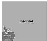
Aplicación correcta logotipo en aviso