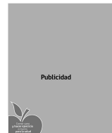
Aplicación incorrecta logotipo en aviso