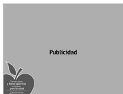
Aplicación logotipo vertical