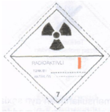
Radioaktiv maddə (I qablaşdırma kateqoriyası)